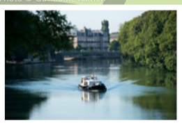
Centre-ville de Verdun (FR)