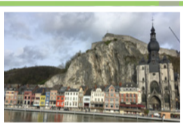
Collégiale Notre Dame (BE)