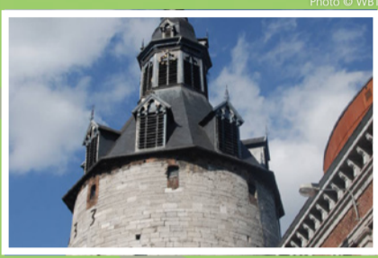
Beffroi de Namur (BE)